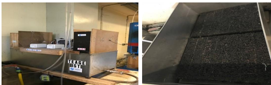
Figura 3: Acondicionamento dos provetes no TEAGE.

Na Figura 3 apresenta-se uma imagem do TEAGE com o acondicionamento dos provetes prismáticos no interior do mesmo.